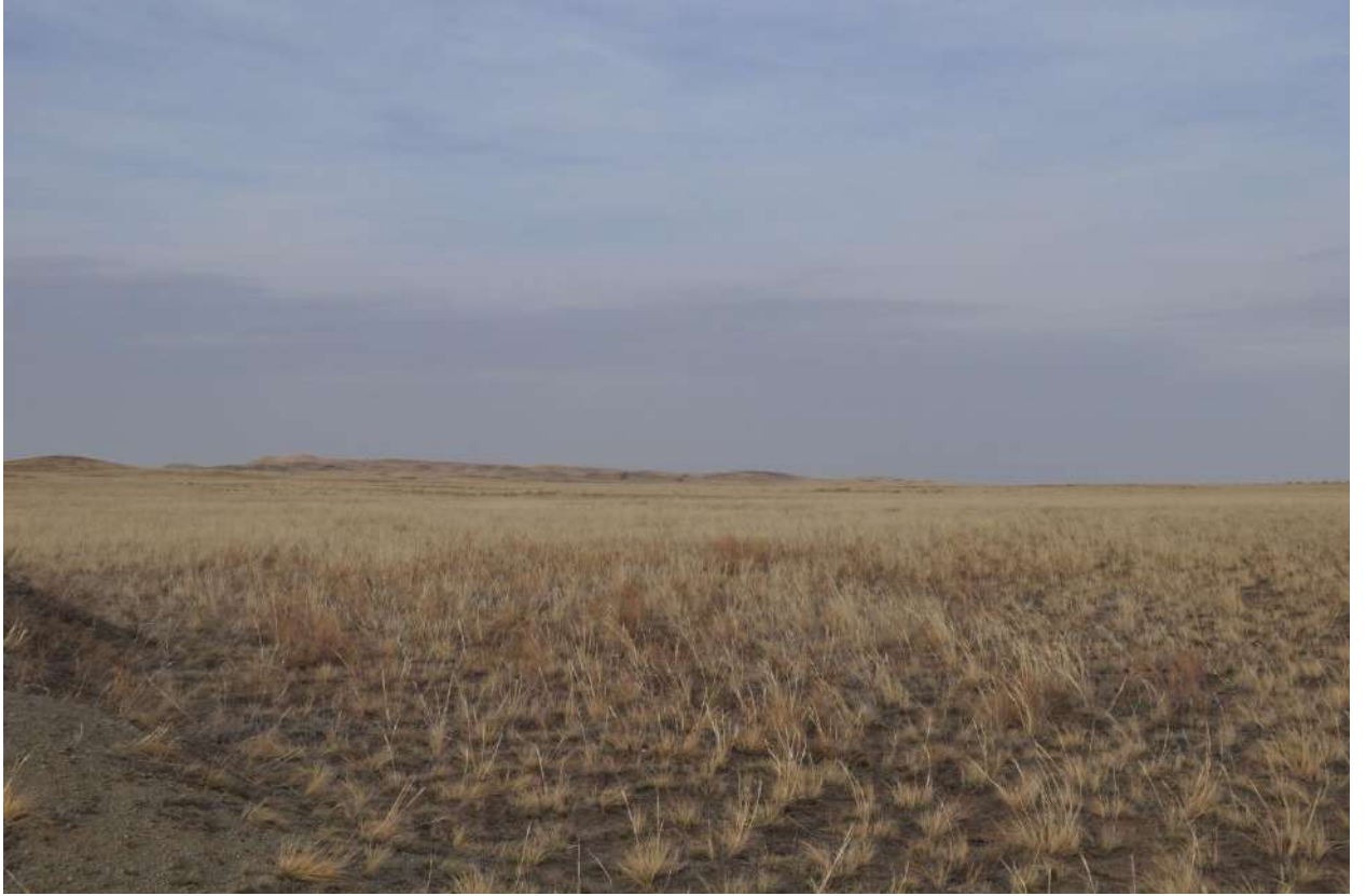
Рис. 6. Общий вид земельного участка. Снято с западной стороны.