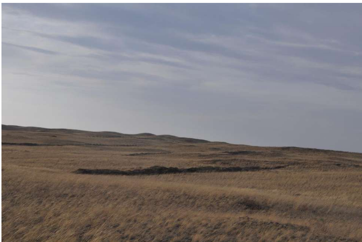
Рис. 3. Общий вид земельного участка. Снято с северной стороны