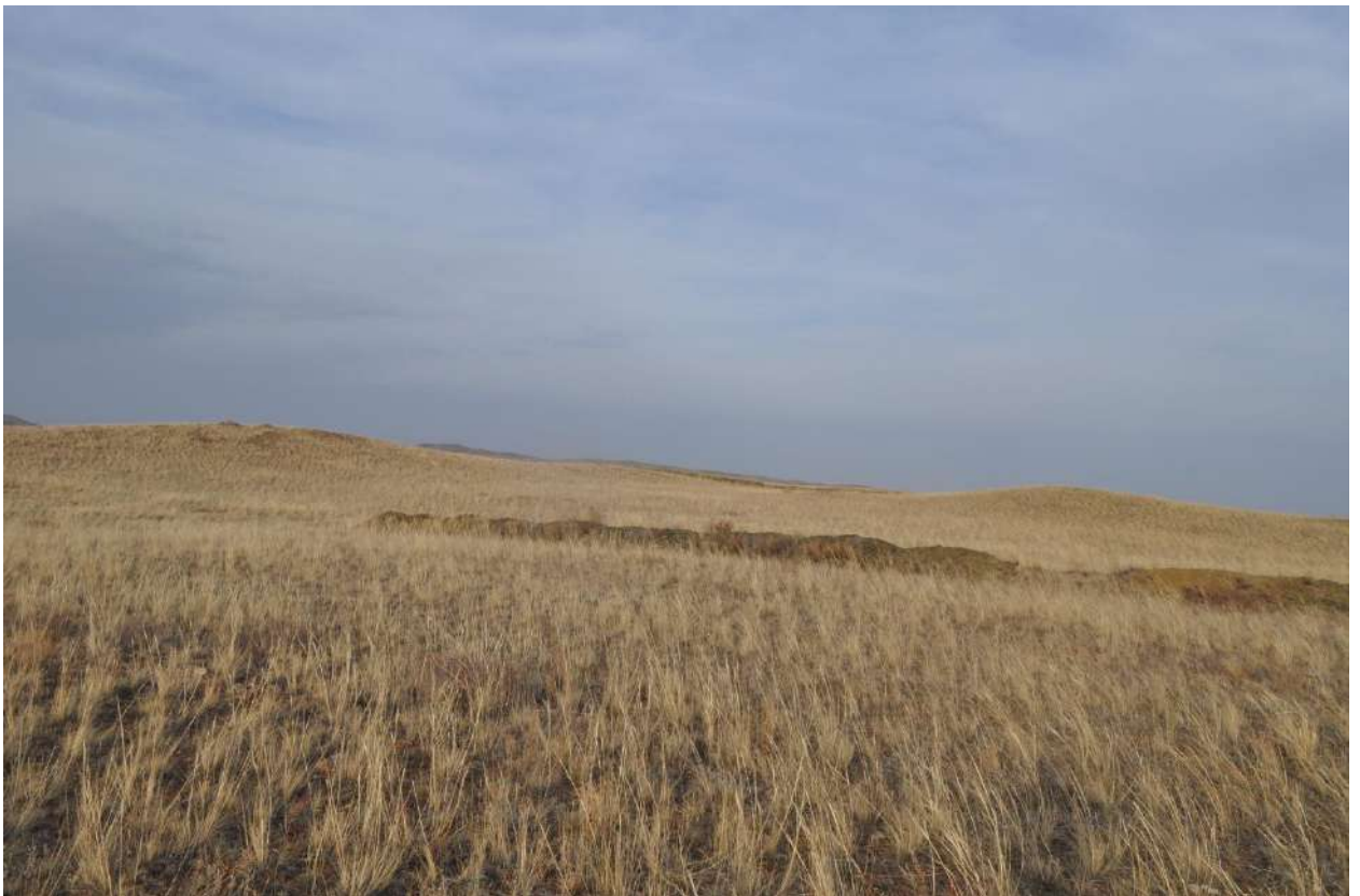
Рис. 5. Общий вид земельного участка. Снято с восточной стороны.