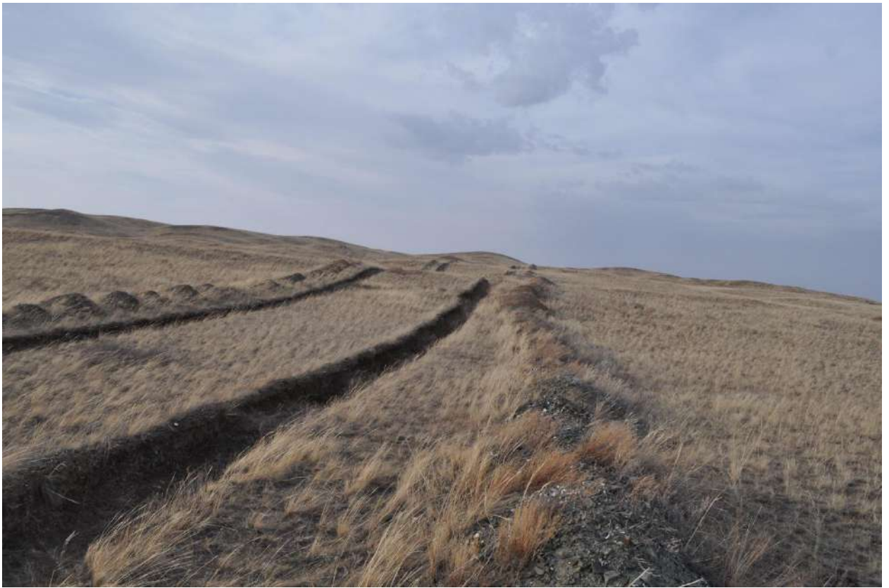
Рис. 4. Общий вид земельного участка. Снято с южной стороны