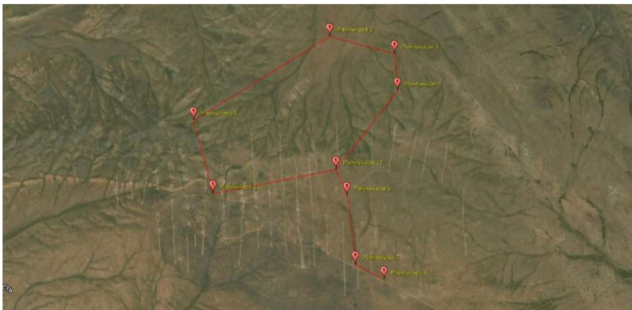
Рис. 2. Общий вид земельного участка с космоснимка